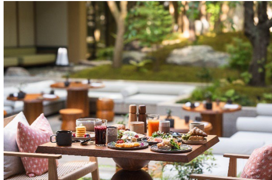
朝食はセミブッフェ形式をご用意します