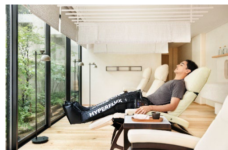
バイオハック リカバリー セッション

シックスセンス スパの特徴でもある、伝統的な手法に加えて、最新テックを使ったリラクゼーションで、筋肉と心の回復を促します。