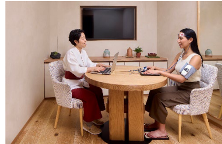
ウェルネススクリーニング

約40の主要なバイオマーカーで、心身に関連する状態をチェック。私たちのウェルネスのプロフェッショナルが、その結果について説明し、お客様の健康のゴールに沿って次のステップをご提案していきます。