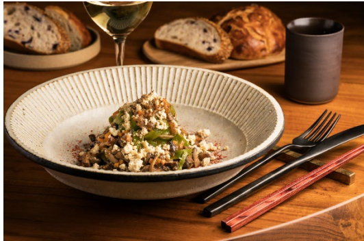
植物由来のプラントベース ディナーコース

お食事は、オールデイダイニング「Sekki」で肉や魚を使わないプラントベースのディナーコースをご用意。Sekkiの名の通り、二十四節気に合わせた旬の野菜を使用し、季節ごとに必要な栄養を摂取できるコースで、体の内側からもウェルネスをサポートします。翌朝の朝食はセミブッフェ形式の滋味豊かな料理の数々で、ご出発前のエネルギーをチャージしていただけます。