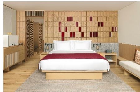
デラックス キング (42㎡)