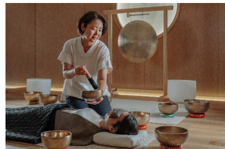
サウンドジャーニー&メディテーション

シンギングボウルやさまざまなツールの音と振動によって、心身へと働きかけるセッションです。