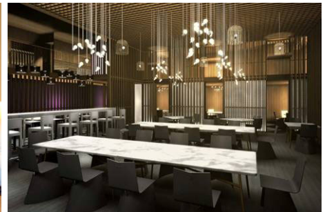
Bei 中国北部、日本、韓国の伝統的なスタイルの影響を受けたコンテンポラリーなアジア料理をお楽しみいただけます