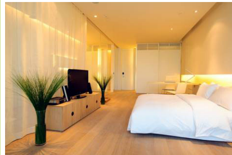
客室 は、天然木材を用いたフローアー、そして極めてシンプルなデザインにチャイニーズタッチを巧みに織り交ぜています

ザ・オポジットハウスとは、中国古来の家造り様式「四合院」の中庭において、母屋の反対側に建つ建物が大切なゲスト用に利用されていたことから、その建物を示す中国語を英訳した名前です。また、ホテルがザ・ビレッジの中庭風デザインの南側にあるということも反映されており、さらには、古いものと新しいもの、東洋と西洋、ボヘミアンとシック等、多様性があり、対照的なものが共存する三里屯地区そのものも表現しています。