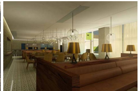
Sureño 地中海の新鮮な食材をカジュアルにスタイリッシュにお楽しみください

ご予約は、オンラインブッキング www.theoppositehouse.com または、プリファード・ホテルズ & リゾーツ (0120-747755) をご利用いただけます。